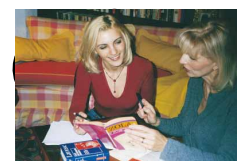
Nauczyciel na wyłączność