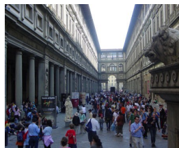
Kurs to znakomita okazja do zwiedzania. Możesz wreszcie poznać muzea Florencji...

klientek. Inni także zachwalają. Możliwości kursu 40+ jest bardzo wiele i to na całym świecie. Mamy Anglię, Irlandię, Włochy, Francję, Hiszpanię, Malte, w zasadzie wszędzie tam gdzie chcielibyście jechać! Kursy są ciekawe, zajęcia popołudniowe zorganizowane bardzo dobrze, zakwaterowanie zawsze zgodnie z waszymi oczekiwaniami. Nie musicie się oba-